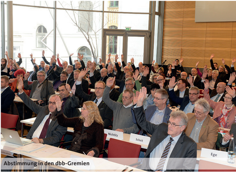
Abstimmung in den dbb-Gremien